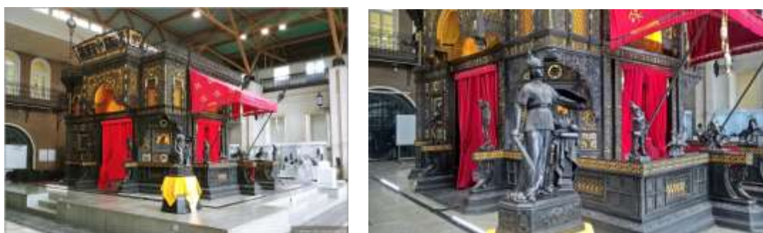
Рисунок 5. Каслинский чугунный павильон Екатеринбургский музей изобразительных искусств

Каслинский чугунный павильон — всемирно известное произведение из Каслинского чугунного литья, шедевр мирового искусства, единственное в мире архитектурное сооружение из чугуна. Входит в список всемирного наследия ЮНЕСКО. Реликвия хранится в Екатеринбургском музее изобразительных искусств. (Слайды 34)