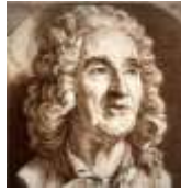
Рисунок 2 Этьен Морис Фальконе

(Слайд 26) Экскурсовод: Перед вами статуэтка Фортуна (сообщает информацию этикетки и озвучивает наиболее важные ключевые слова из текста альбома).