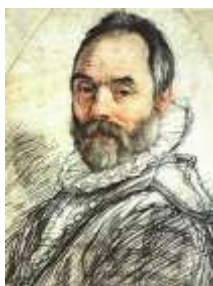
Рисунок 3. Джамболонья, Джованни да Болонья

(Слайд 28) Экскурсовод: автор произведения Джамболонья, Джованни да Болонья (1529 - 1608, ) — флорентийский скульптор-маньерист и представитель раннего барокко.