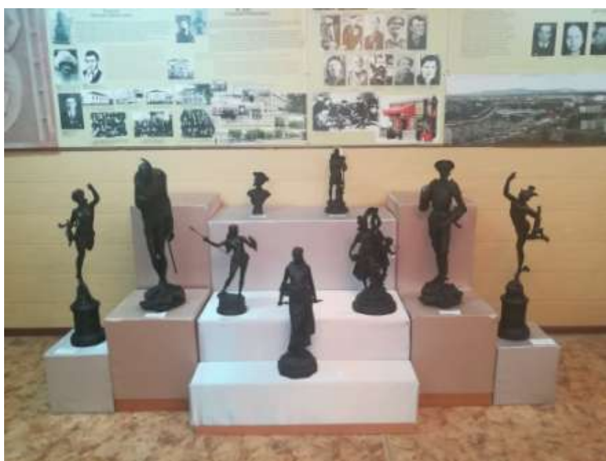
Рисунок 1. Экспозиция: «Западноевропейская скульптура XVI -XIX-го веков в каслинском литье»

Преподаватель: Друзья мои, приглашаю вас совершить виртуальную экскурсию и посетить наш техникумовский музей художественного литья имени Зотова Бориса Никитовича, и познакомимся с его экспонатами, с искусством каслинских мастеров. Сегодня там открылась новая экспозиция: «Западноевропейская скульптура XVI -XIX-го веков в каслинском литье». Правда, наша экскурсия будет воображаемой, поэтому постараемся представить, что слайды презентации и страницы альбомов вдруг превратились в музейный зал, где вас ждут интересные встречи с прекрасным. В качестве экскурсовода – буду я. Надеюсь, что вы с пользой для себя проведёте сегодня время. Приятного вам просмотра! (Слайды 15,16,17,18,19)